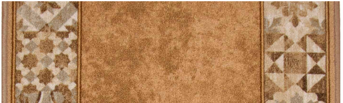
35 67cm - 80cm - 100cm