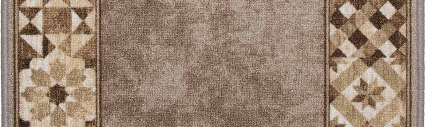
34 67cm - 80cm - 100cm