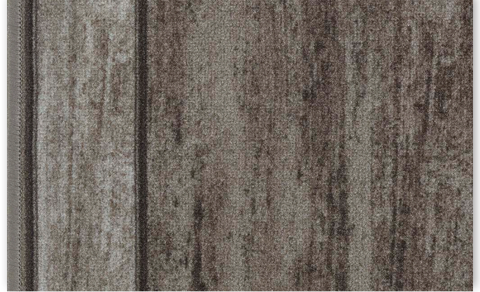
49 67cm + 80 cm + 100 cm