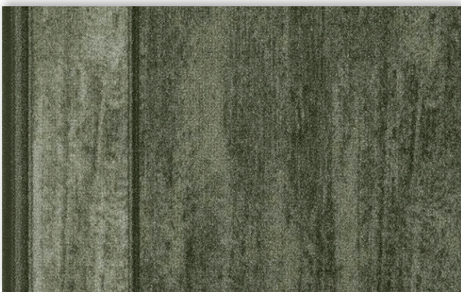
29 67cm + 80 cm + 100 cm

La société Associated Weavers se réserve le droit de modifier les caractéristiques de ce produit tout en conservant les mêmes qualités techniques. Il est fortement conseillé d'utiliser les coloris moyens et foncés pour les pièces à grand trafic.