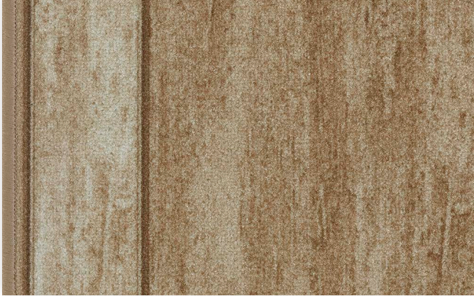
33 67cm + 80 cm + 100 cm